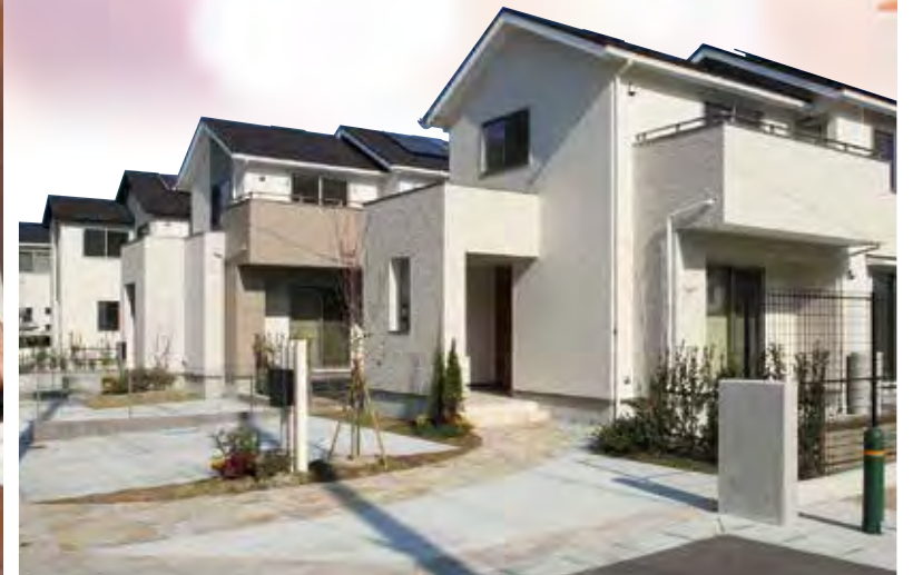
既分譲「シアンズコート」街並

ZENグループ 住まいを通じて一生のお付き合い 西洋ハウジング SEIYO HOUSING ～お客様にとってのオンリーワン企業を目指して～