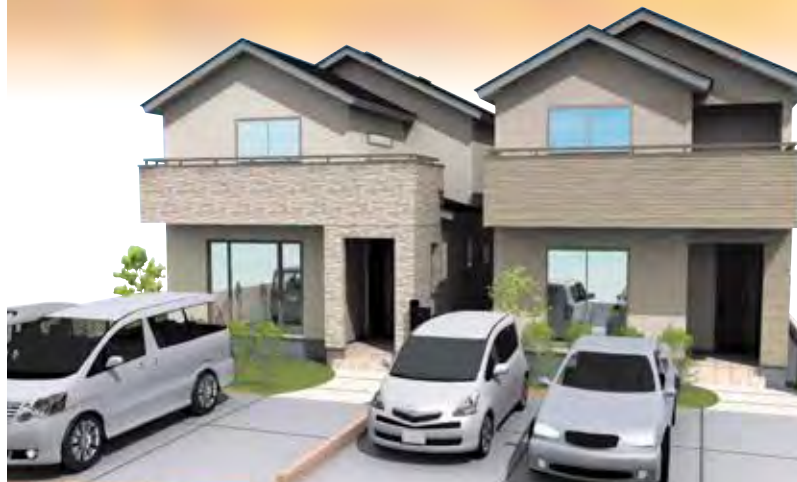
今回分譲の「シアンズコート田子V」完成予想図

お子様をキッズコーナーで遊ばせておくことができますので、 安心してご相談いただけます。